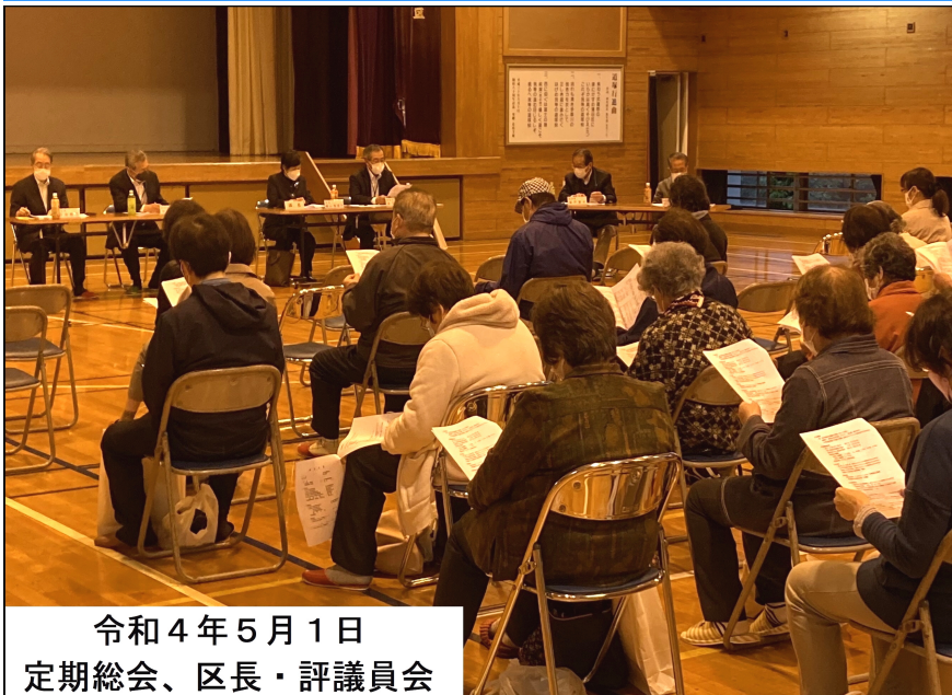
令和4年5月1日 定期総会、区長・評議員会