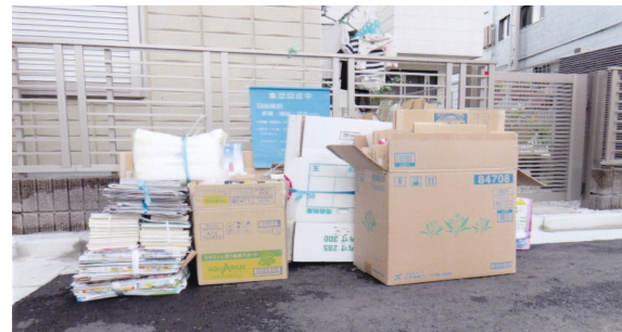
▲協力頂いている地区の集積所の様子です