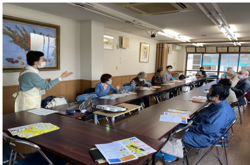
▲道塚サロンは3密を避け、人数制限で開催

「地域の人が気軽に集まれる場をつくる試み」で自由参加の道塚サロンを毎月開催しています。 ◆7月・薬の飲み方講座 ◆8月・マイタイムライ