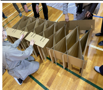
段ボールベッドの組立風景